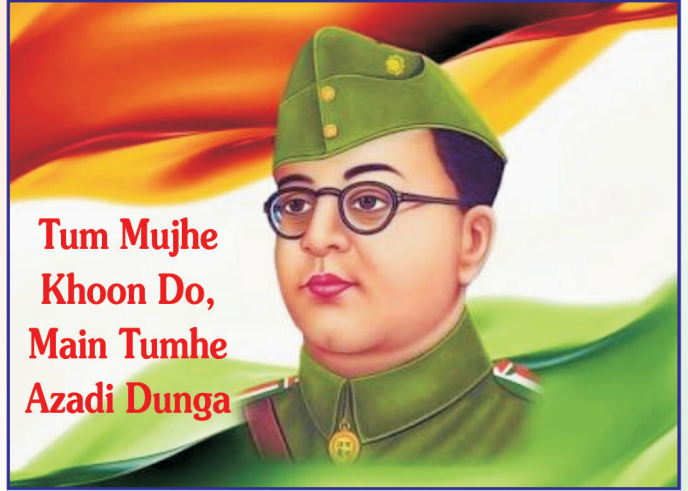
Neta Ji Subhash Jayanti - 23rd January