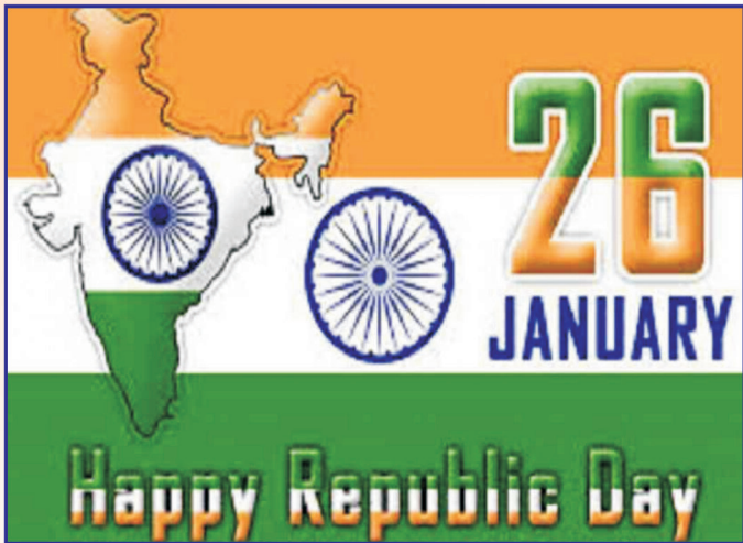
Happy Republic Day